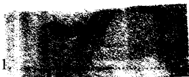
1. /Младен СИМОВ/